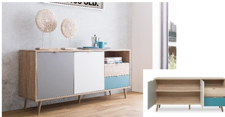
APARADOR 2C +2P Cód. 395196