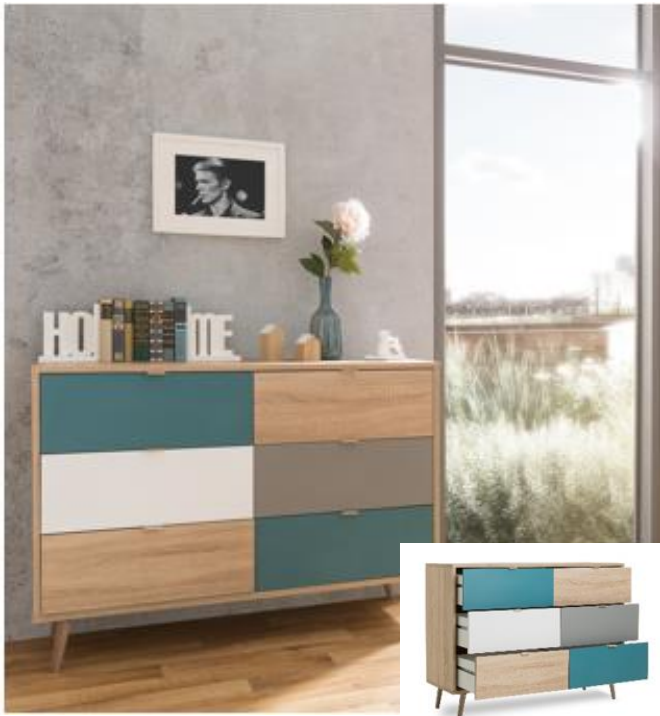
CÓMODA 6 CAJONES Cód. 395195