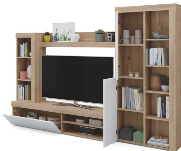
COMPACTO TV 226 L226xA173xP 40 f cm. Cód.: 111890