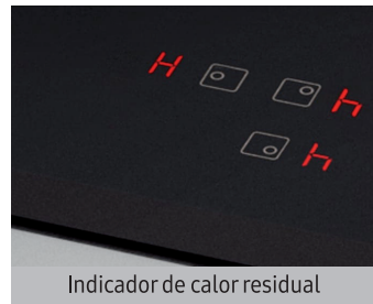
Indicador de calor residual