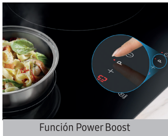
Función Power Boost